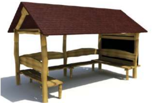
Vizualizace mají informativní charakter.